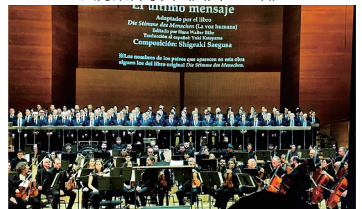
2025.11.30 バルセロナ音楽堂で(20時~22時 合唱“最後の手紙”14曲通して)