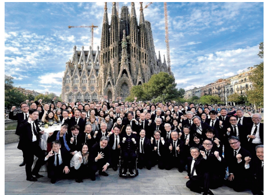
サグラダファミリア教会をバックに六男集合写真(団員100名)