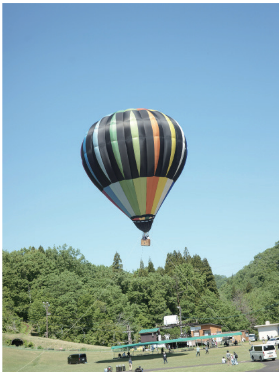
2026.5.10 金谷山<熱気球で空飛ぶ体験>