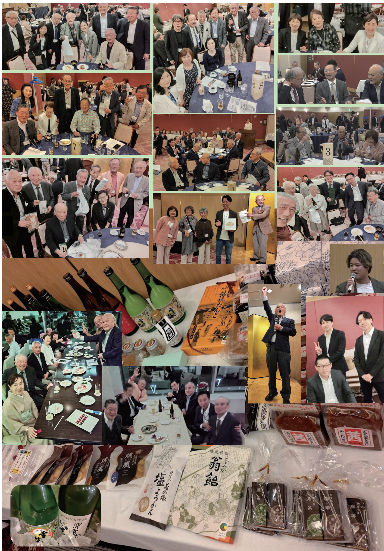
◎次号「たより」は令和8年7月25日の発行です。