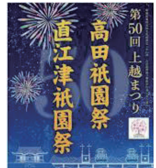
注：令和7年ポスター

祭り期間中は、高田と直江津が神輿で結ばれ、19の屋台と迫力ある御饌米(おせんまい)奉納でフィナーレを迎えます。