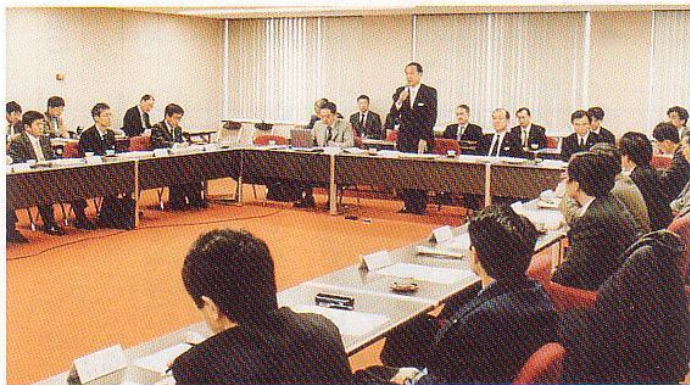
▲精力的に仕事を進めています

このことは、私が選挙戦を通じて主張してきた「身の丈にあった市政」を実践していくことで実現されるものと確信しています。市民の皆さんとの率直な対話を通じて、市民が誇りと愛着の持てる「市民本位のまちづくり」を推進するため、誠心誠