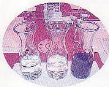
左から能鷹 岩の原ワイン(白) 岩の原ワイン(赤)

高田公園は日本3大夜桜といわれますが、Jネットの桜も数年後には花が咲いてご覧頂けると思えます。ぜひ、みなさん、いっしょにふるさとでお花見をしましょう。また、様々な活動を通して、いっしょにJネットを盛り上げていきましょう。