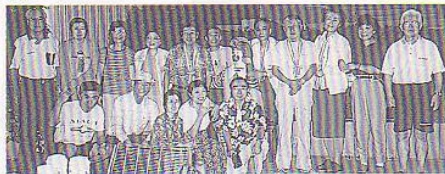
▶ 平成12年ハワイゴルフツアー旅行にて

昭和30年に「福祿会」は誕生した。県立高田高等学校を昭和29年、新制高校第6回卒業のフクロクから命名された同期会である。「東京福祿会」はその東京支部で30年の歴史がある。