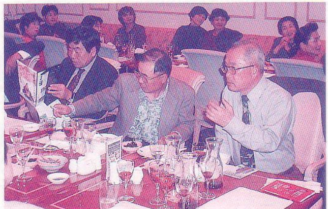
▲ふるさとをつまみに歓談