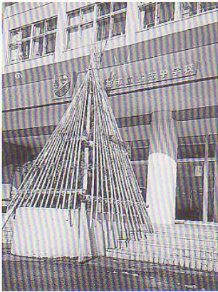
▶ 現校舎の正面玄関