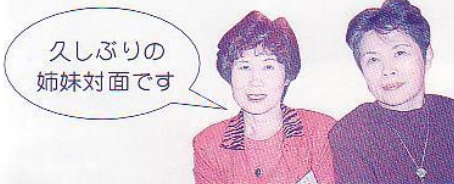
久しぶりの 姉妹対面です