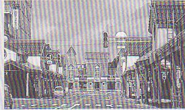
▲高田駅前の平成雁木

東海道よりも早い時期に全通した信越本線の駅であり、越後における西洋文化波及起點の場所であった歴史を持つ高田駅前に、「和と洋の出会いと共存（瓦と煉瓦）」を基本コンセプトの一つとした計画をしていきます。アーケードによって駅正面を創り出していきます。