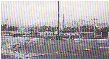
▲ グランドから見た妙高連峰