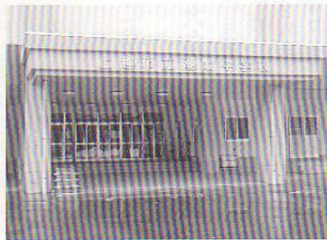
▲ 現校舎の正面玄関