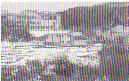
▲ 有間川から望む潮陵中学校 (左から潮陵中学校、谷浜地区多目的研修センター、谷浜小学校)

過疎化・少子化の影響からか生徒数は、現在は69名となっております。市内では最も生徒数の少ない学校かもしれません。しかしながら、HPから窺われる、近代的な校舎でのICTなどを活用した最新の教育と海・川・山に隣接するという豊かな自然環