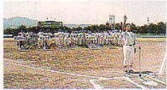
注: 法政大学経営学部教授 野球部長として「尽力いただきました」