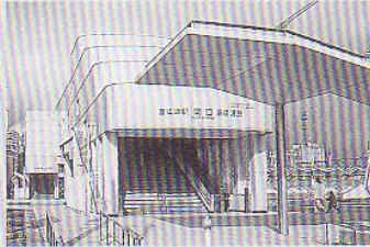
▶ 駅裏の玄関「南口」、高田方面への玄関口として整備されています。

昨年10月初旬、全国規模のイベント「農都市ウィーク」が駅前のホテルセンチュリーイカヤ（旧いかや旅館）で行われました。各フォーラムや学術会議に参加させていただき、今昔ともに文化の発信点と感じました。