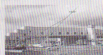
▶ 駅前北口と駅裏南口間の通路は、あすか通りと名付けられ市民に親しまれています。