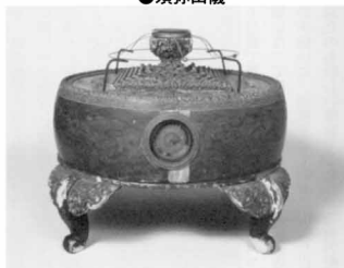
地球儀ならぬ宇宙儀ですね。動くようです。